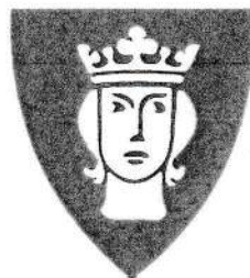
staten Konungariket Sverige Monarkin Staten Sverige