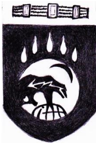
ordning Godland Östersjöväldet